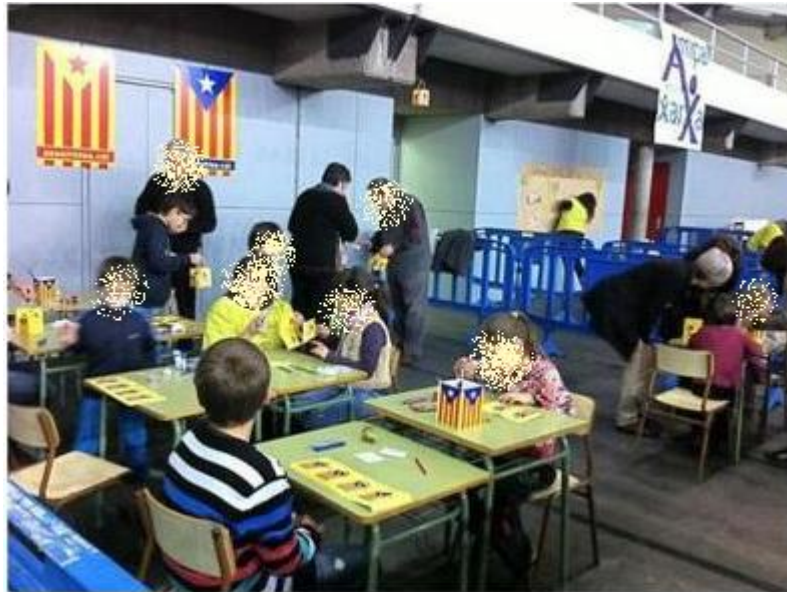
Imagen 3. Alumnos de una escuela de Berga (Barcelona)

En la siguiente fotografía puede apreciarse a alumnos de pocos años de la localidad barcelonesa de Berga realizando sus actividades rodeados de símbolos separatistas.