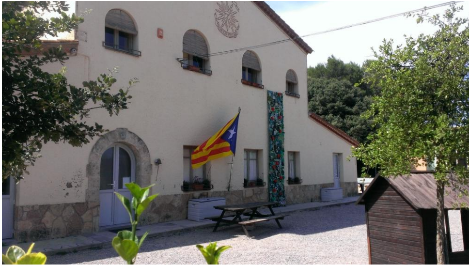
Imagen 1. Fachada de la escuela pública de la localidad gerundense de Porqueras