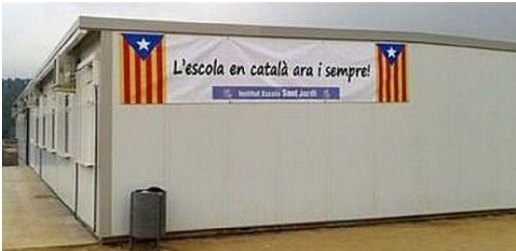
Imagen 2. Fachada de la escuela pública de la localidad barcelonesa de Navás